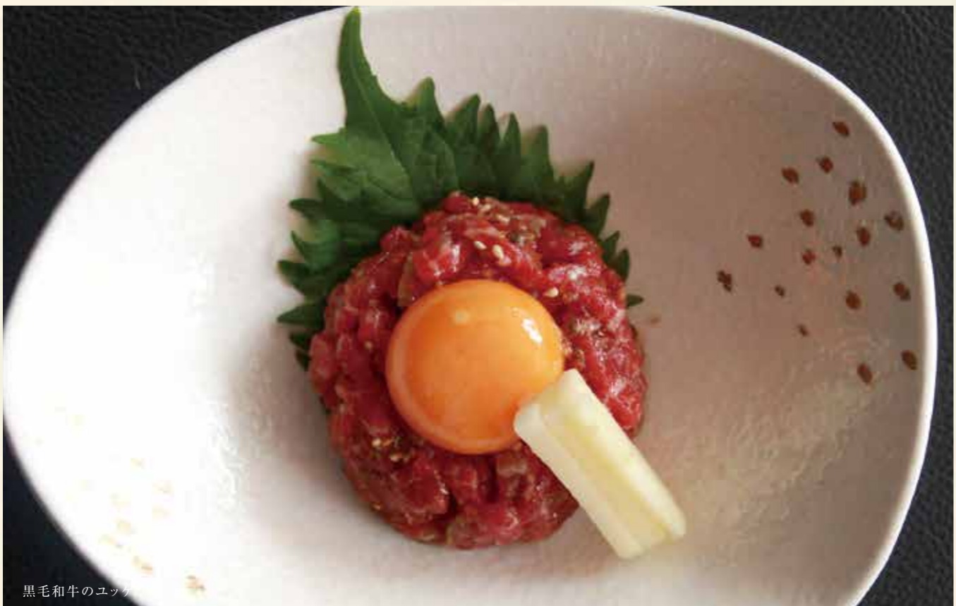
黒毛和牛のユッケ