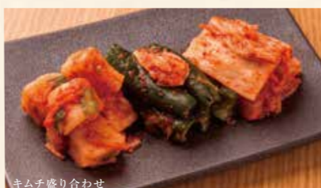
キムチ盛り合わせ