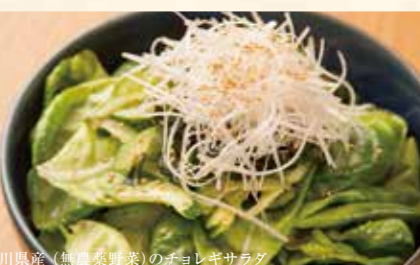
石川県産(無農薬野菜)のチヨレギサラダ