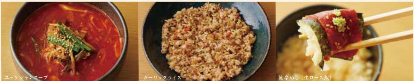
ユッケジャンスープ