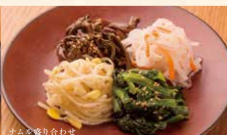
ナムル盛り合わせ