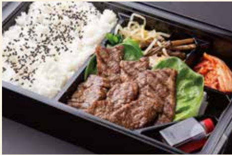
ハラミ弁当 (ハラミ) ¥2,600/大盛り ¥3,200