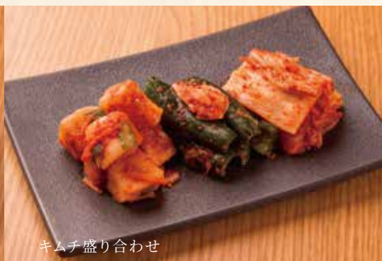
キムチ盛り合わせ