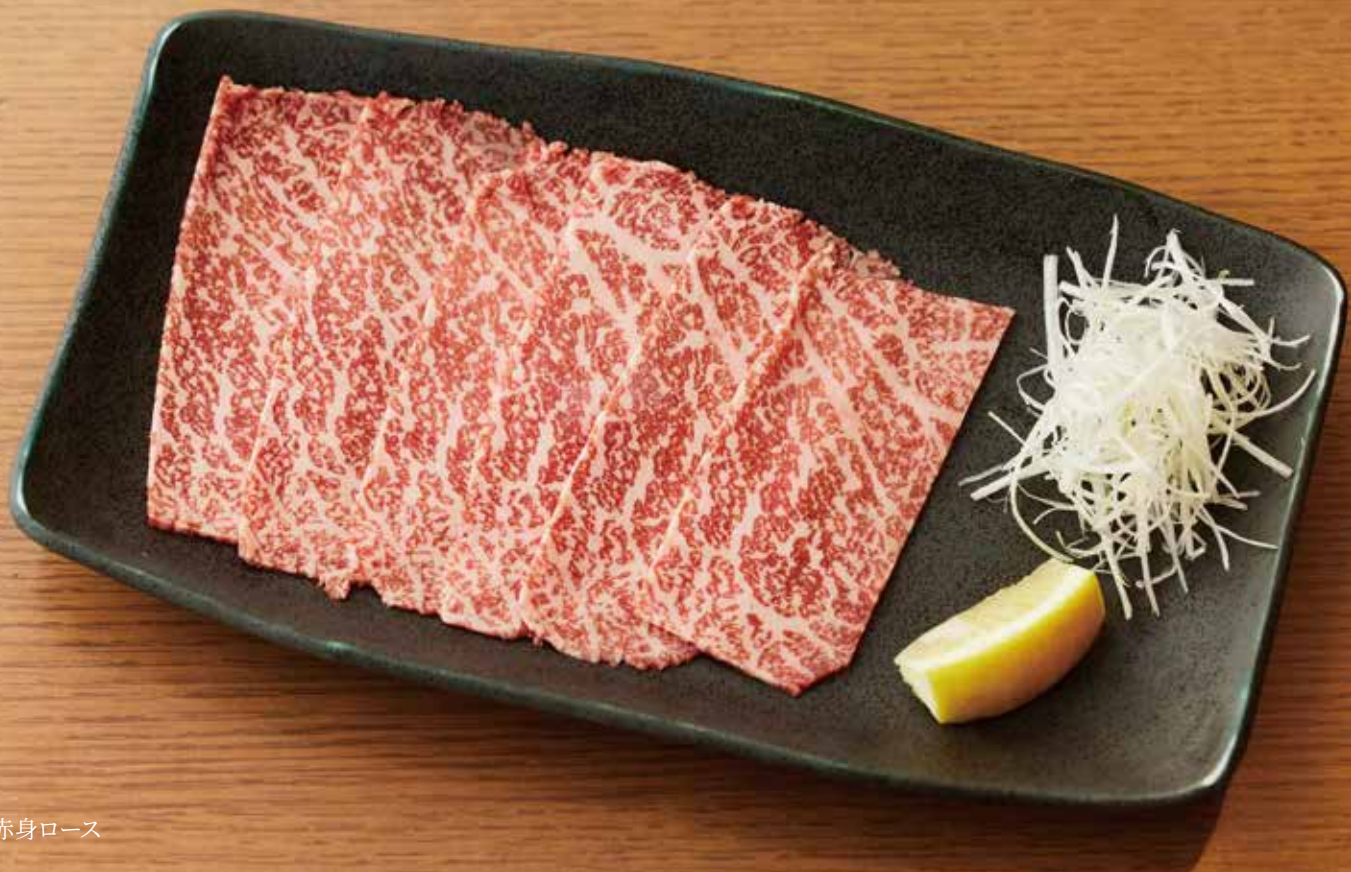
厳選 上赤身ロース