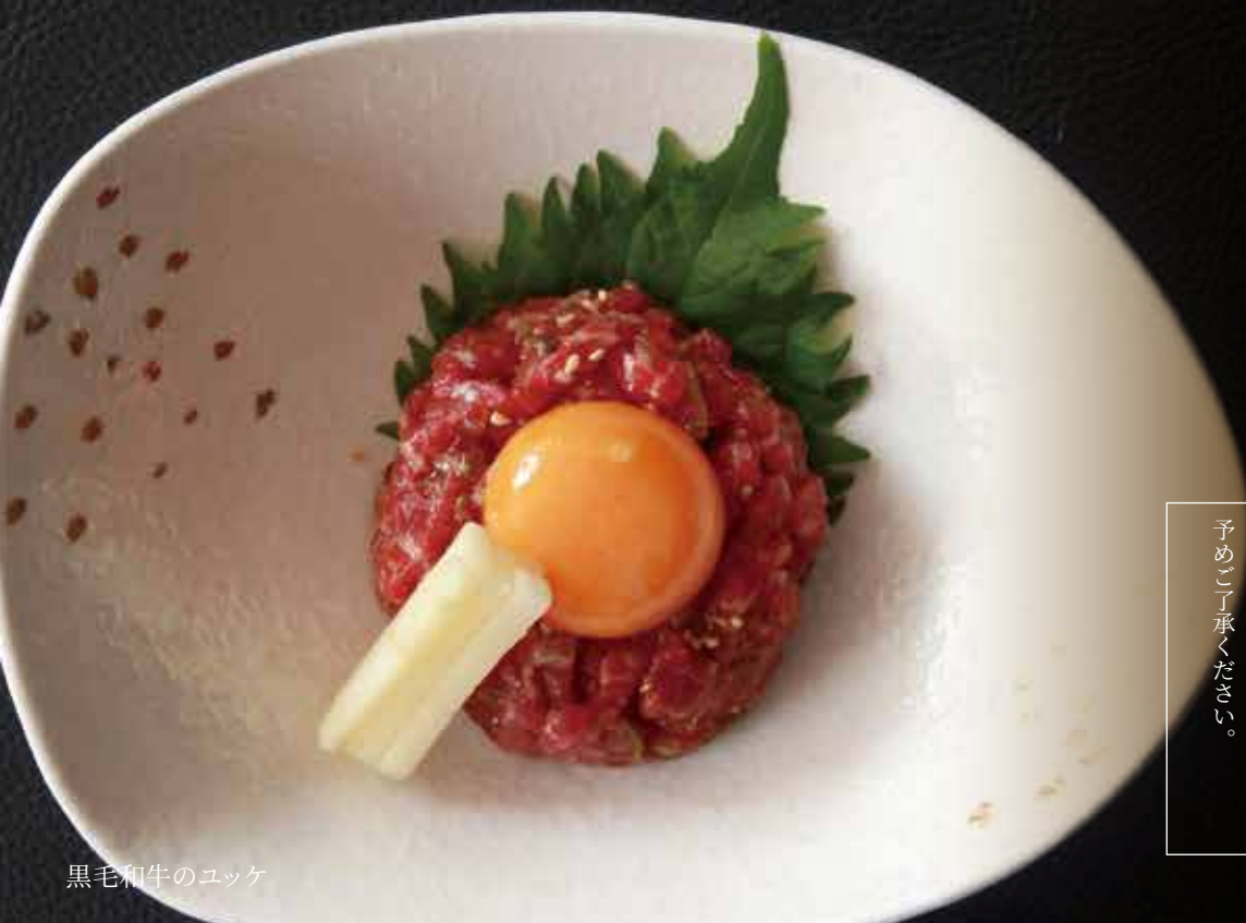
黒毛和牛のユッケ

当店は、世田谷区保健所より認定された認定生食用肉取扱者等設置施設としてユッケ／牛刺しをご提供しております。一般的に、牛肉の生食は食中毒のリスクがございます。お子様やご高齢のお客様には、ご提供を控えさせて頂く場合がございます。予めご了承ください。