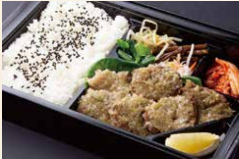
タン塩弁当 (名物ねぎタン塩) ¥3,000/大盛り ¥3,900