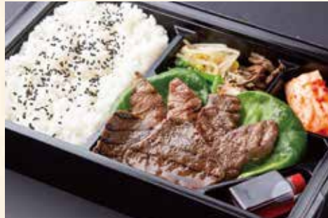
焼肉弁当 (カルビ、ハラミ、モモ肉) ¥2,700/大盛り ¥3,600