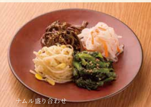
ナムル盛り合わせ