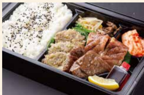
特上まんぷく弁当 (名物上ねぎタン塩、上カルビ、上赤身ロース) ¥3,600/大盛り ¥4,800

当日のお持ち帰りだけではなく事前予約も承っておりますので メニュー詳細やご要望などお気軽にスタッフまでお申し付けください。 ※お弁当をお買い上げのお客様には韓国海苔をお付けいたします。