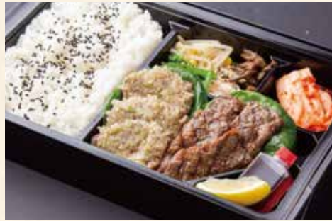
まんぷく弁当 (名物ねぎタン塩、ハラミ) ¥2,800/大盛り ¥3,700