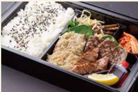
上まんぷく弁当 (名物上ねぎタン塩、カルビ、モモ肉) ¥3,200/大盛り ¥4,200