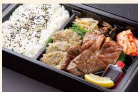
特上まんぷく弁当 (名物上ねぎタン塩、上カルビ、上赤身ロース) ¥3,600/大盛り ¥4,800

当日のお持ち帰りだけではなく事前予約も承っておりますので メニュー詳細やご要望などお気軽にスタッフまでお申し付けください。 ※お弁当をお買い上げのお客様には韓国海苔をお付けいたします。