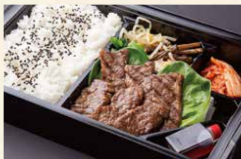
ハラミ弁当 (ハラミ) ¥2,600/大盛り ¥3,200