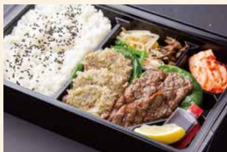
まんぷく弁当 (名物ねぎタン塩、ハラミ) ¥2,800/大盛り ¥3,700