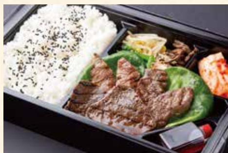
焼肉弁当 (カルビ、ハラミ、モモ肉) ¥2,700/大盛り ¥3,600