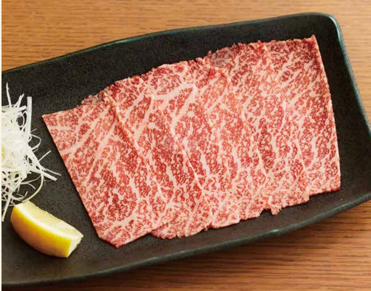
厳選 上赤身ロース

脂身の多いホルモンは、一度に大量に焼くと火災事故に繋がる場合があります。安心してお楽しみいただくため、一定量ずつ焼いていただける様、お願い申し上げます。