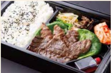
焼肉弁当 (カルビ、ハラミ、モモ肉) ¥2,700/大盛り ¥3,600

各種ご用意がございます。当日のお持ち帰りだけではなく事前予約も承っておりますのでメニュー詳細やご要望などお気軽にスタッフまでお申し付けください。 ※お弁当をお買い上げのお客様には韓国海苔をお付けいたします。