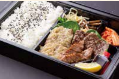
上まんぷく弁当 (名物上ねぎタン塩、カルビ、モモ肉) ¥3,200/大盛り ¥4,200