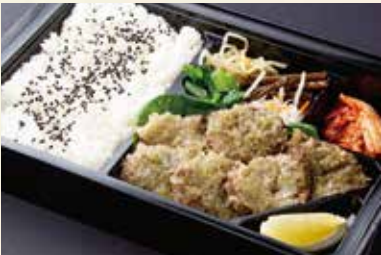
タン塩弁当 (名物ねぎタン塩) ¥3,000/大盛り ¥3,900