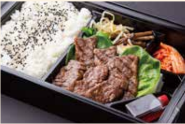
ハラミ弁当 (ハラミ) ¥2,600/大盛り ¥3,200