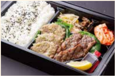
まんぷく弁当 (名物ねぎタン塩、ハラミ) ¥2,800/大盛り ¥3,700