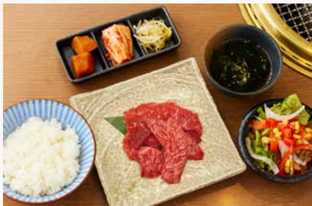
特撰切り落とし御膳【数量限定】 1,580

本日の前菜三種、秘伝のドレッシングのサラダ 特撰切り落とし肉 ライス・本日のスープ