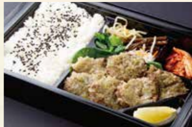
タン塩弁当 (名物ねぎタン塩) ¥2,300/大盛り ¥3,050