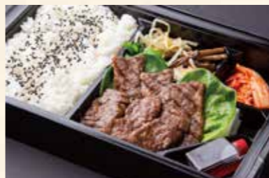
ハラミ弁当 (ハラミ) ¥2,000/大盛り ¥2,650