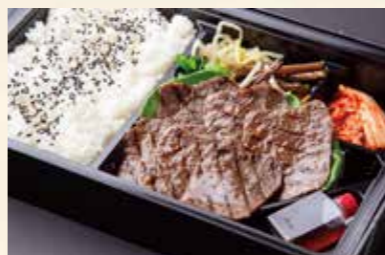
赤身弁当 (モモ肉) ¥2,200/大盛り ¥2,950