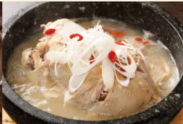
自家製サンゲタン