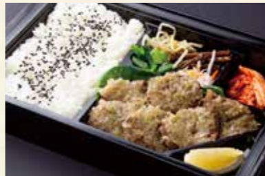
タン塩弁当 (名物ねぎタン塩) ¥2,000/大盛り ¥2,600