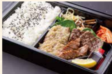
上まんぷく弁当 (名物ねぎタン塩、カルビ、モモ肉) ¥2,400/大盛り ¥3,200