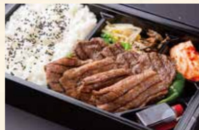
上赤身弁当 (上モモ肉) ¥3,200/大盛り ¥4,500