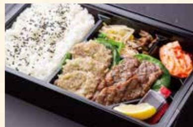
まんぷく弁当 (名物ねぎタン塩、ハラミ) ¥2,000/大盛り ¥2,600