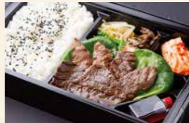
焼肉弁当 (カルビ、ハラミ、モモ肉) ¥2,000/大盛り ¥2,500

各種ご用意がございます。当日のお持ち帰りだけではなく事前予約も承っておりますのでメニュー詳細やご要望などお気軽にスタッフまでお申し付けください。