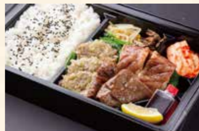
特上まんぷく弁当 (上ねぎタン塩、上カルビ、上赤身ロース) ¥2,800/大盛り ¥3,700